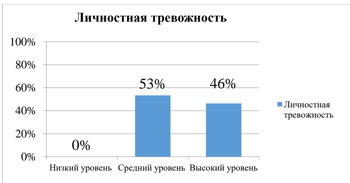
Рисунок 3. Результаты исследования уровня личностной тревожности тест Спилбергера-Ханина «Определение тревожности»

Анализ результатов, представленных на рисунке 3, показал, что в группе преобладает средний уровень личностной тревожности, который составил 53% (n=8 человек), высокий уровень личностной тревожности составил 46 % (n=7 человек). Студенов с низким уровнем личностной тревожности нет.