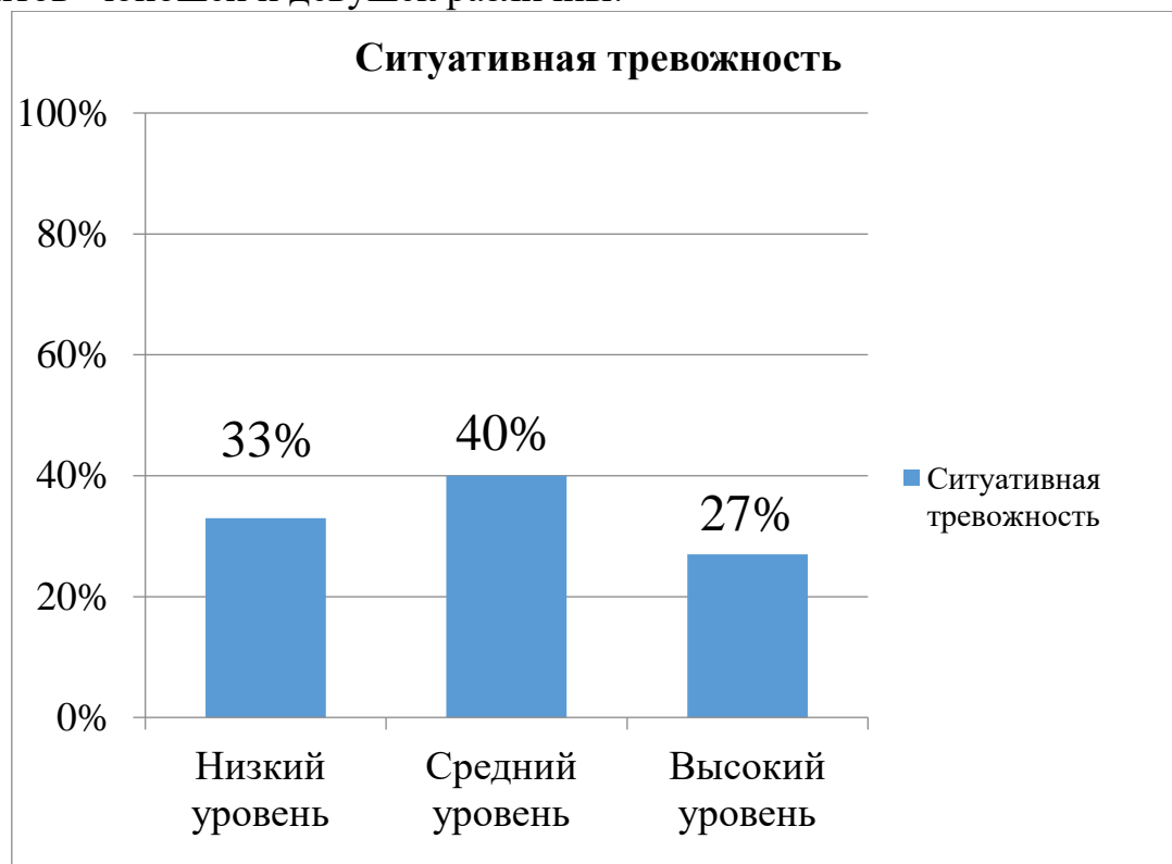
Рис 2. Результаты исследования уровня ситуативной тревожности тест Спилбергера-Ханина «Определение тревожности»

Исходя из полученных результатов по методике Спилбергера - Ханина «Определение тревожности», мы можем отметить, что уровни тревожности у студентов - юношей и девушек различны: