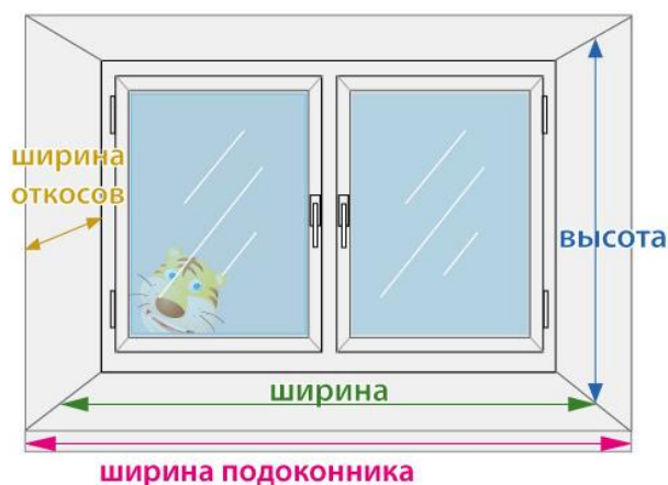
Рис. 1. Параметры замеров окна

удобнее измерять. Так младшие школьники узнают, что такая мерка называется дециметр. В изучении данной темы мы предлагаем жизненную ситуацию: замерить ширину откосов, высоту и ширину окна, ширину подоконника (см. рис.1) для заказа окна. Для этого ребята делятся на 3 команды и каждой предоставляется окно в классе. С помощью модели дециметра ребята убеждаются, что это делать лучше и быстрее, чем измерение моделью сантиметра.